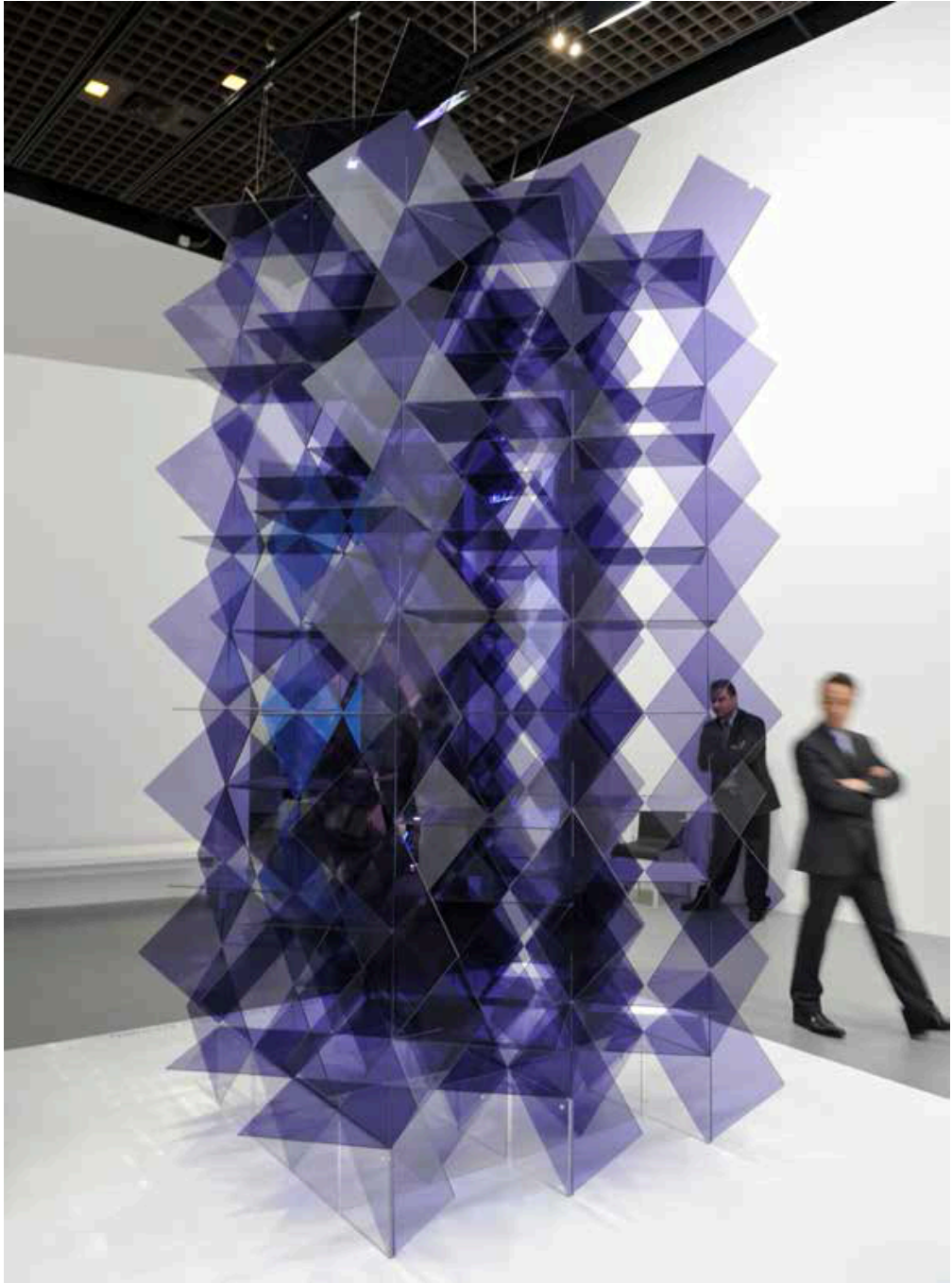
Vue de l'exposition Dynamo , Grand Palais, Paris, 2013 / Exhibition view, Dynamo , Grand Palais, Paris, 2013