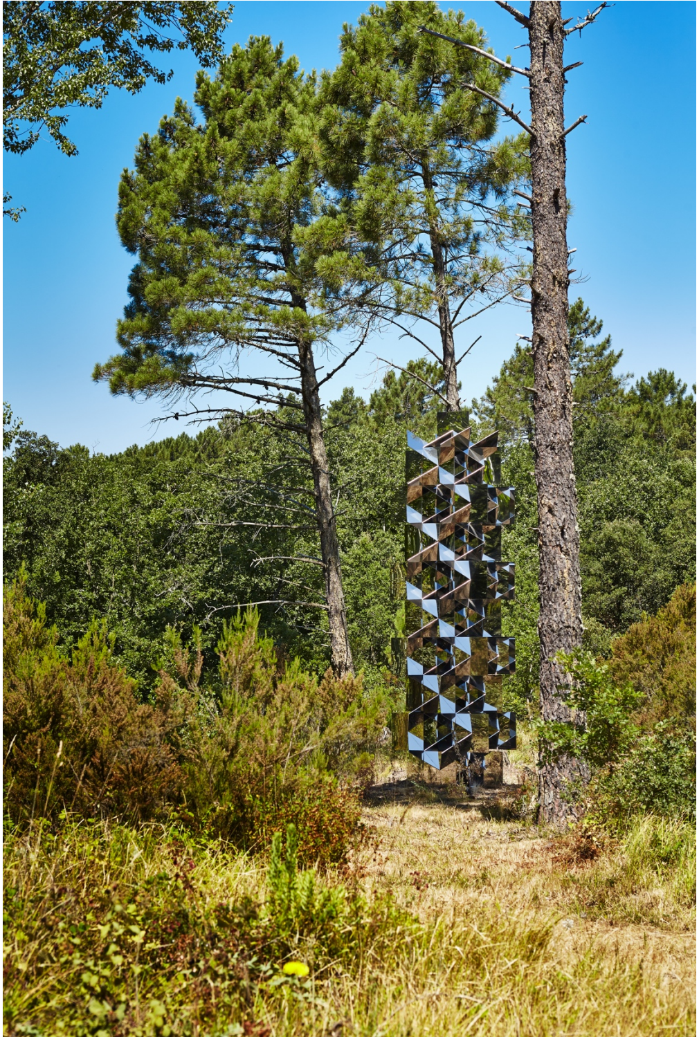
Francisco Sobrino Structure permutationnelle, Acier poli miroir / Mirror-polished stainless steel H 600 x 180 x 180 cm Unique