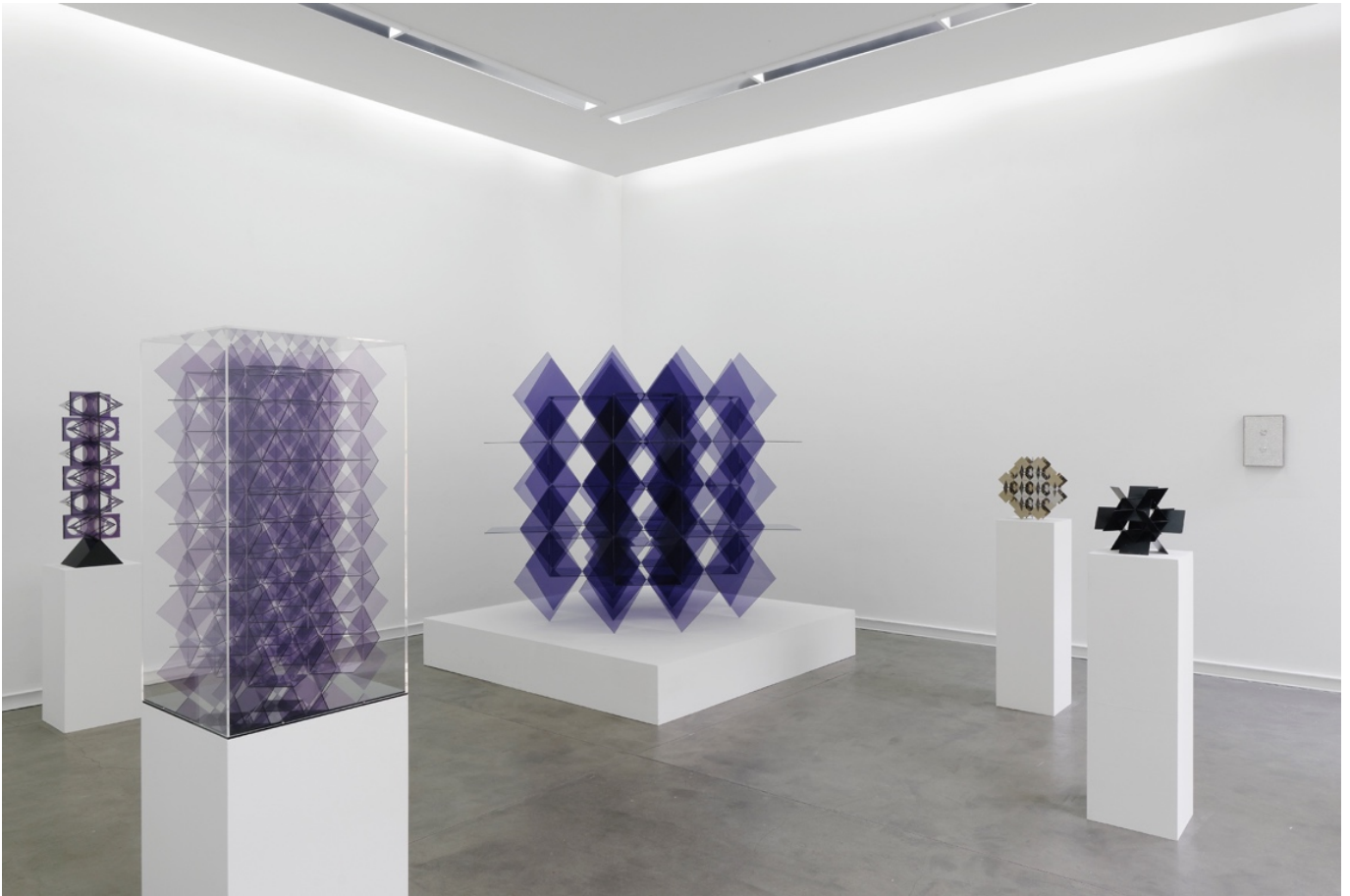
Vue de l'exposition Modus Operandi , Galerie Mitterrand, Paris, 2017 / Exhibition view, Modus Operandi , Galerie Mitterrand, Paris.

79 RUE DU TEMPLE 75003 PARIS - T +33 1 43 26 12 05 F +33 1 46 33 44 83 INFO@GALERIEMITERRAND.COM WWW.GALERIEMITERRAND.COM