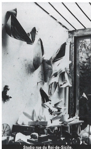
Studio rue du Roi-de-Sicile.

Pour la première fois, les sculptures murales d'Alicia Penalba sont mises en lumière dans une présentation exclusive à la galerie A&R Fleury. Ces œuvres emblématiques des années 1960, une période charnière pour l'artiste, redéfinissent la sculpture murale en y intégrant la lumière et en allégeant les volumes. En 1961, Alicia Penalba reçoit le prix de la sculpture à la Biennale de São Paulo, reflet d'une créativité sans limites.